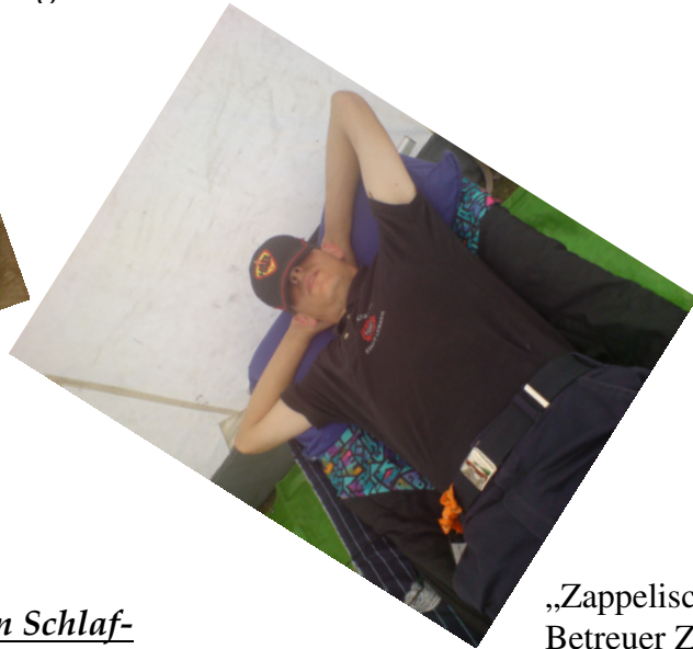
„Zappelisch“ Betreuer Zug 2

Lasst uns auch eure schönsten Schlaf- fotos zukommen und wir veröffent- lichen sie an dieser Stelle.