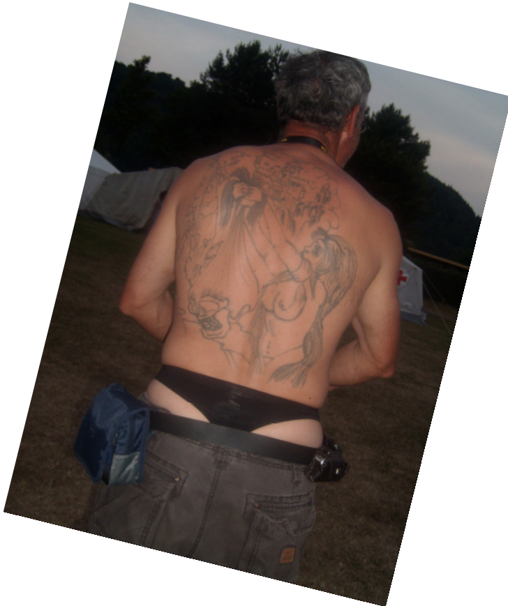
The Tanga Man!