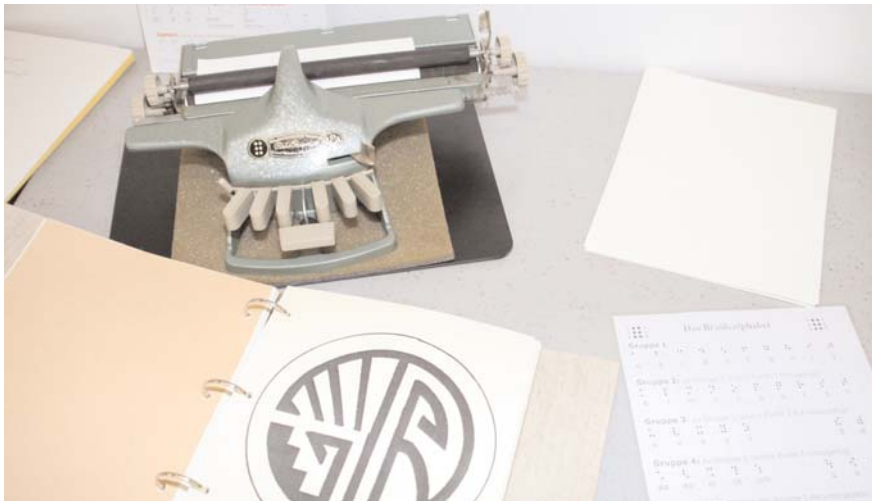
Grundlage für Bildung und Selbstbestimmung: Punkschrift nach Jaques Braille, oben eine spezielle Braille-Schreibmaschine

Sechs Richtige, so BSV-Vorsitzender Herbert Reck, das wünschen sich viele; für Blinde und Sehbehinderte sind die sechs Punkte zur wichtigsten Sache geworden. Diese sechs Punkte bilden das Raster für 64 Kombinationsmöglichkeiten, mit denen die einzelnen Buchstaben dargestellt werden.