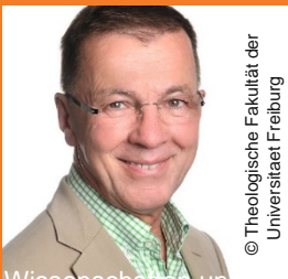
© Theologische Fakultät der Universität Freiburg

Dienstag, 28. April 2020 · 19.30 - 21.00 Uhr